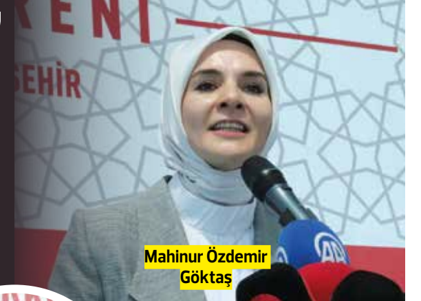
Mahinur Özdemir Göktaş

KARARLILIKLA UYGULUYORUZ Vali Yılmaz ise, bir toplumun olgunluğunun, gençlerine verdiği değerle olduğu kadar, büyüklerine gösterdiği vefayla da ölçüldüğünü kaydederek, "Eskişehir, bu vefa anlayışını en çok yaşatması gereken şehirlerin başında gelmektedir. Yunus Emre'nin 'Sevdim, sevillelim' sözleriyle özdeşleşmiş, dünyaya 'Sevgi Şehri' olarak tanıtılan bir şehrin, sevgisini, en çok da ömrünü bu topraklara adanmış büyüklerine göstermesi gerektiğine inanıyorum. Nasreddin Hoca'nın hikmetle yoğrulmuş bilgeliği de bize aynı dersi veriyor. Yaş almak, hayata farklı bir pencereden bakabilmektir. Bugün açılışını yaptığımız bu merkez, işte bu inancın, sevginin ve hikmetin somut bir yansımasıdır. Aile ve Sosyal Hizmetler Bakanlığımız, bu anlayışla, artan yaşlı nüfusunun yaşam kalitesini yükseltmeye dönük yeni politikalar geliştirmekte; koruyucu, önleyici ve toplum temelli hizmet modellerini yaygınlaştırmaktadır. Biz de Eskişehir olarak, aktif ve sağlıklı yaşlanma stratejilerimizi kararlılıkla uygulayarak bu yeni politika anlayışını sahada hayata geçiren illerin başında gelmekten büyük bir onur duyuyoruz" diye konuştu.