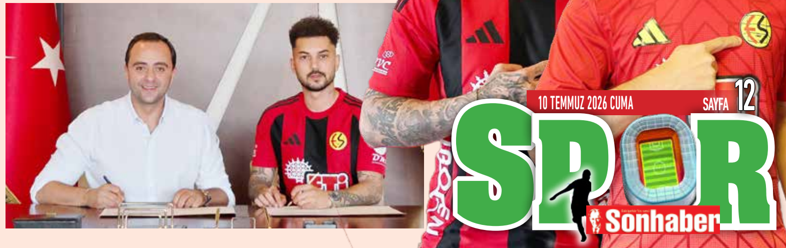
10 TEMMUZ 2026 CUMA

Toplumsal afet hazırlığını güçlendirmeyi hedefleyen ESAG'ın eğitimleri önümüzdeki süreçte ilk yardım, yangın güvenliği, telsiz ve iletişim gibi başlıklarda devam edecek. Programın ikinci oturumu ise 11 Temmuz Cumartesi günü saat 11.00'de Ergin Orbey Sahnesi'nde düzenlenecek. Katılımın ücretsiz olduğu programa tüm gönüllü adayları davet edildi. HABER MERKEZİ