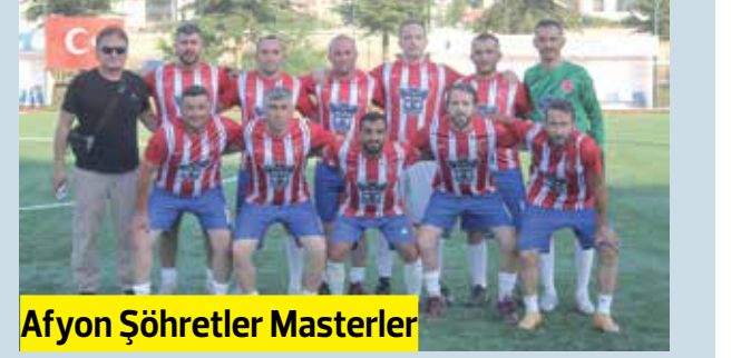
Afyon Şöhretler Masterler

oldu. Karşılaşmanın ardından iki takım futbolcuları mangal organizasyonunda bir araya gelerek eski günleri yad etti. Afyon ekibi, Eskişehir Veteranları kısa süre içinde Afyonkarahisar'da düzenlenecek dostluk maçına davet etti. HABER MERKEZİ