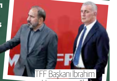
TFF Başkanı Ibrahim Hacıosmanoğlu

■ 3. Lig kulüpleri TFF'nin grupları açıklamasını bekliyor. 1 Temmuz itibarıyla federasyondan hala ses çıkmaması kulüplerde şaşkınlık yaratıyor. Sosyal medyada taraftarlar, TFF'nin 3. Ligi unuttuğunu belirten paylaşımlar yapıyor. >12'DE