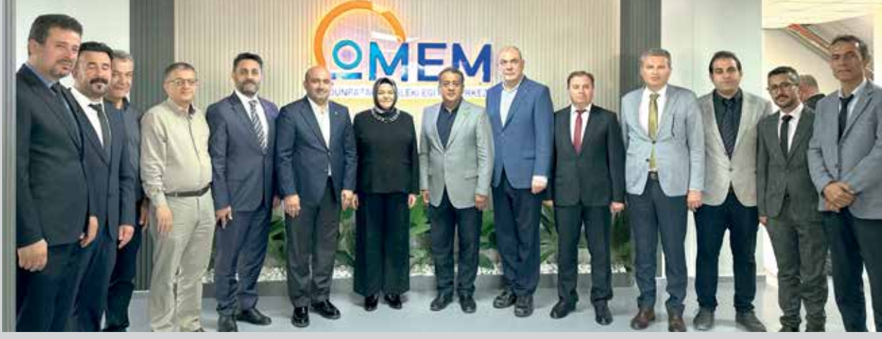
Sayın Yusuf Tekin ile de görüntülü görüşme gerçekleştirildi. Yoğun programına rağmen heyetle görüşerek Odunpazarı Mesleki Eğitim Merkezi'nde yürütülen çalışmalar hakkında bilgi alan Bakan Tekin ile mesleki eğitimin geliştirilmesine yönelik yürütülen projeler, okul-sanayi iş

Ziyarette merkezde yürütülen çalışmalar hakkında bilgi alan heyet, mesleki eğitimin güçlendirilmesi ve sanayi ile iş birliğinin geliştirilmesine yönelik değerlendirmelerde bulundu. Program kapsamında okulun atölye ve eğitim alanlarında incelemelerde bulunan heyet, Odunpazarı Mesleki Eğitim Merkezi'nin yürüttüğü faaliyetler ve geleceğe yönelik projeleri hakkında bilgi aldı. Ziyarette, mesleki eğitimin üretim süreçleriyle daha güçlü şekilde buluşturulmasının önemi vurgulanırken, nitelikli insan kaynağı yetiştirilmesine yönelik çalışmalar ele alındı. Ziyaret sırasında Millî Eğitim Bakanı