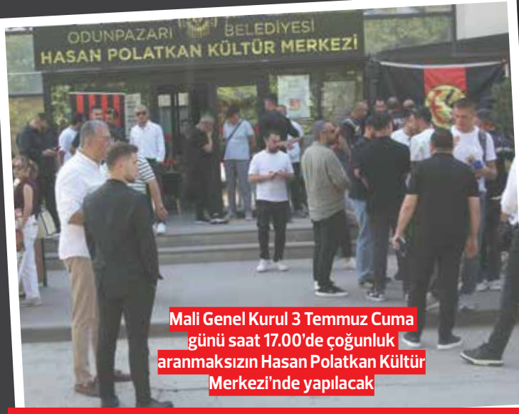
Mali Genel Kurul 3 Temmuz Cuma günü saat 17.00'de çoğunluk aranmaksızın Hasan Polatkan Kültür Merkezi'nde yapılacak