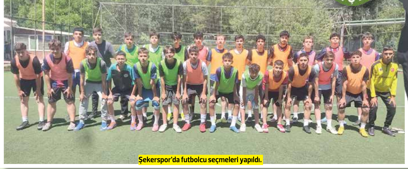
Şekerspor'da futbolcu seçmeleri yapıldı.