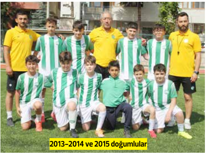
2013-2014 ve 2015 doğumlular