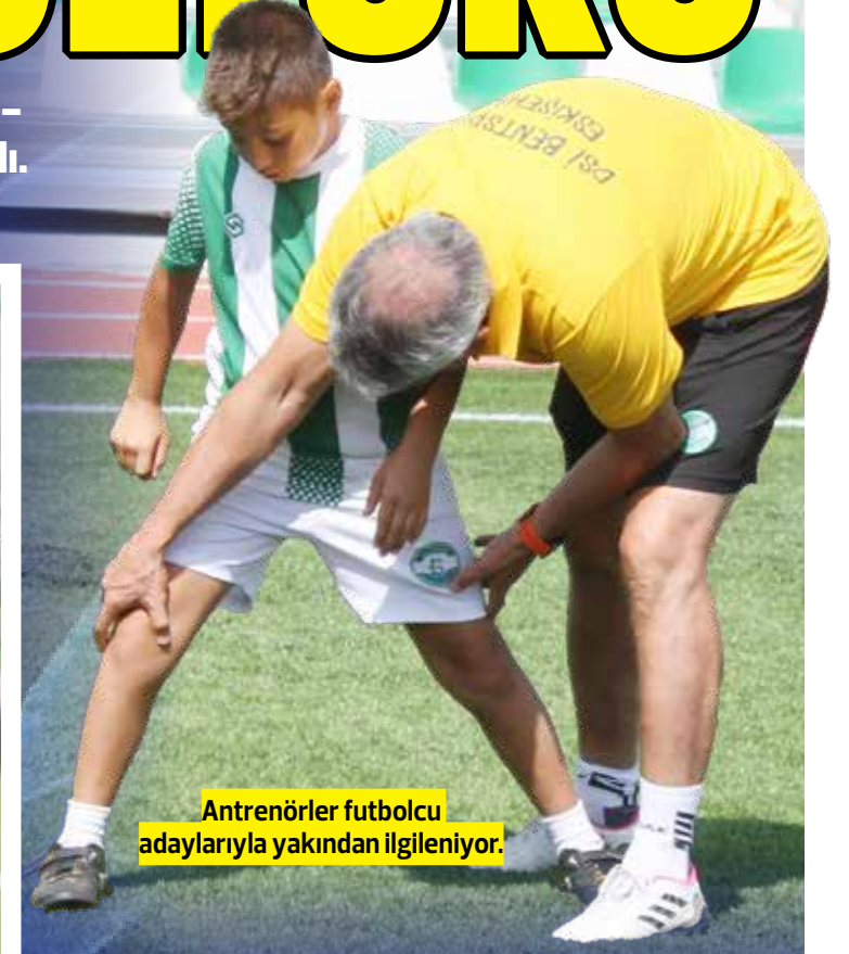
Antrenörler futbolcu adaylarıyla yakından ilgileniyor.