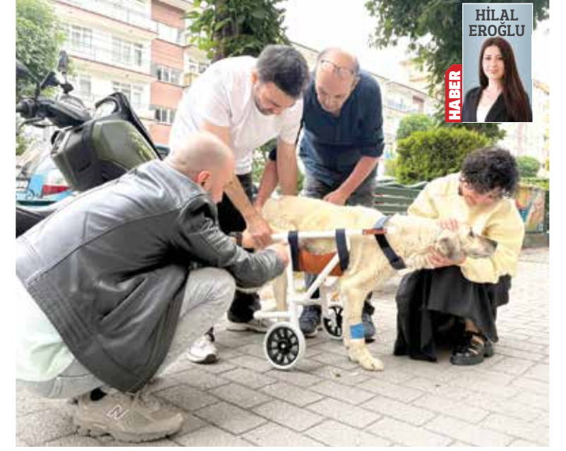
HİLAL EROĞLU HABER

bağlı olarak kemiklerinin güç kaybetmesi nedeniyle artık yaşamını yürüteç desteğiyle sürdürecektir. Nuh'un Gemisi Veteriner Kliniği personeli ve yalnızca mama karşılığında yürüteç üreten hayvanseverin desteği sayesinde Tripod, yeniden hareket edebilecek. Hem Tripod'un sahipleri hem yürüteci hazırlayan hayvansever hem de veteriner hekimler, gösterdikleri özveriyle takdir topladı.