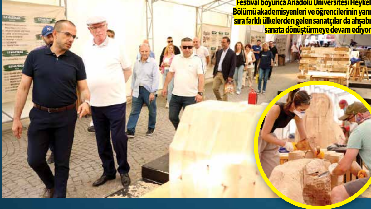
Festival boyunca Anadolu Üniversitesi Heykel Bölümü akademisyenleri ve öğrencilerinin yanı sıra farklı ülkelerden gelen sanatçılar da ahşap sanata dönüştürmeye devam ediyor