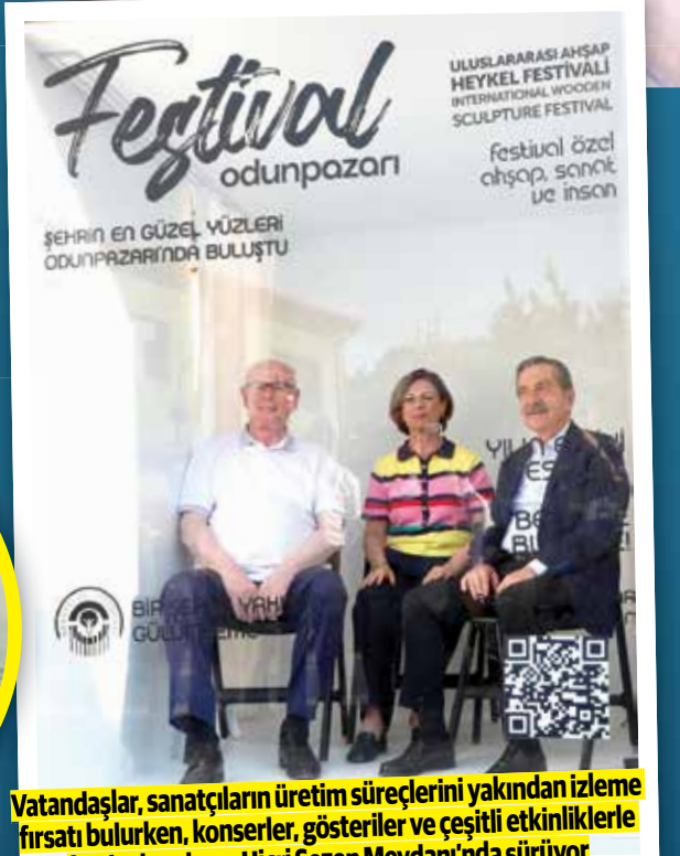
Vatandaşlar, sanatçıların üretim süreçlerini yakından izleme fırsatı bulurken, konserler, gösteriler ve çeşitli etkinliklerle festival coşkusu Hicri Sezen Meydanı'nda sürüyor