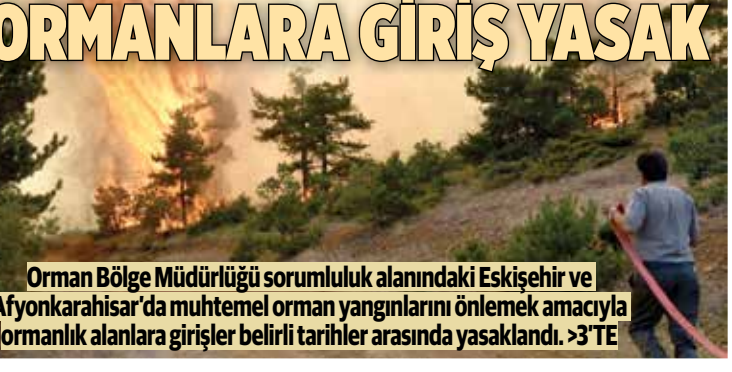
Orman Bölge Müdürlüğü sorumluluk alanındaki Eskişehir ve Afyonkarahisar'da muhtemel orman yangınlarını önlemek amacıyla ormanlık alanlara girişler belirli tarihler arasında yasaklandı. >3'TE

Renk renk Anadolu ■ Odunpazarı Belediyesi Halk Oyunları kursiyerlerinin yıl boyunca hazırladığı 'Renk Renk Anadolu' gösterisi, Hasan Polatkan Kültür Merkezi'nde Eskişehirlilerle buluştu. >2'DE