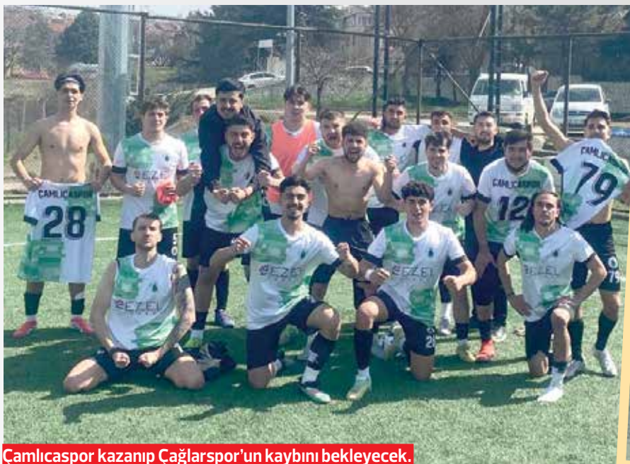
Çamlıcaspor kazanıp Çağlarşpor'un kaybını bekleyecek.