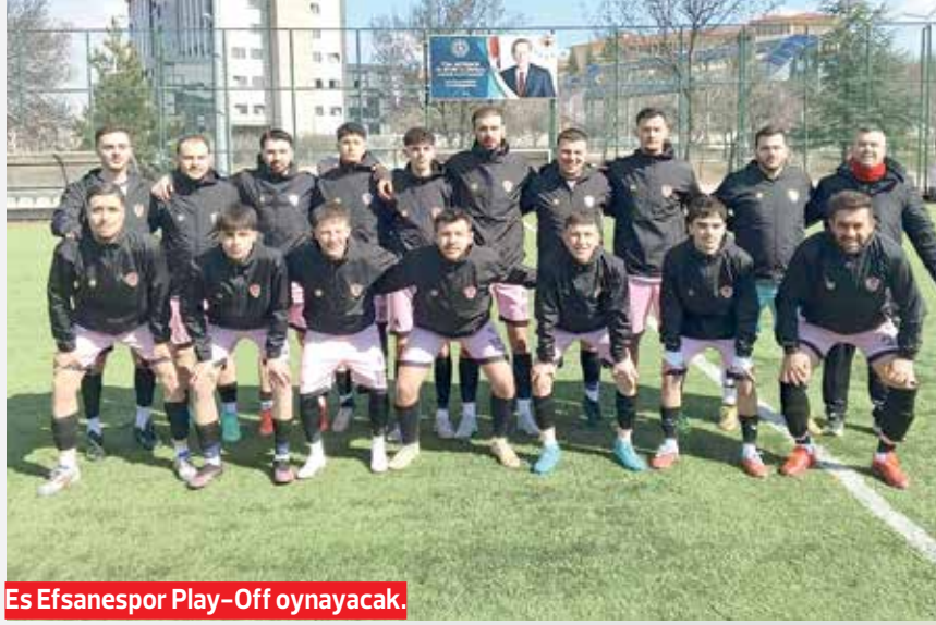
Es Efsanespor Play-Off oynayacak.