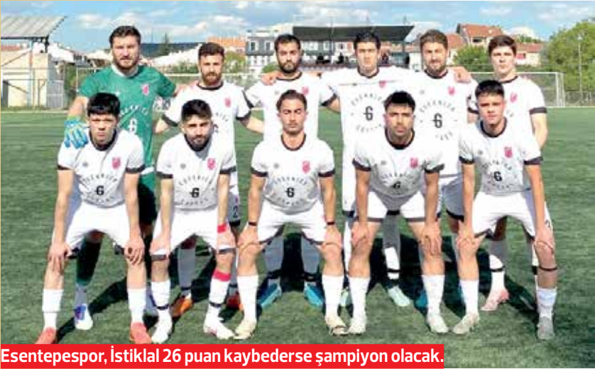
Esentepeşpor, İstiklal 26 puan kaybederse şampiyon olacak.