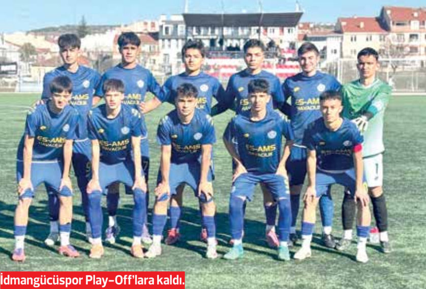
İdmangücüspor Play-Off'lara kaldı.