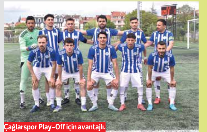
Çağlarşpor Play-Off için avantajlı.