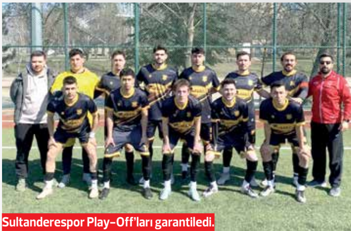
Sultanderespor Play-Off'ları garantiledi.