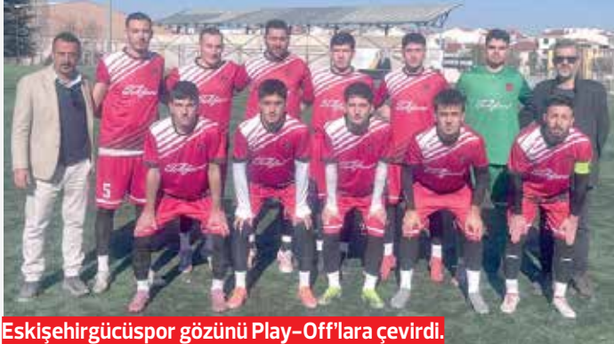
Eskişehirgücüspor gözünü Play-Off'lara çevirdi.