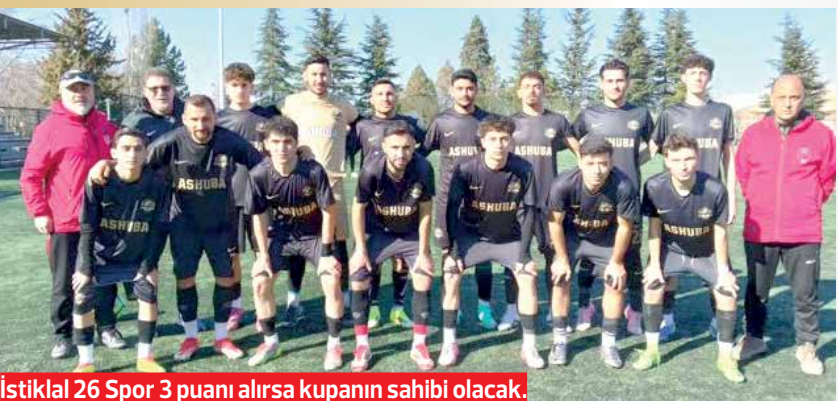
İstiklal 26 Spor 3 puanı alırsa kupanın sahibi olacak.