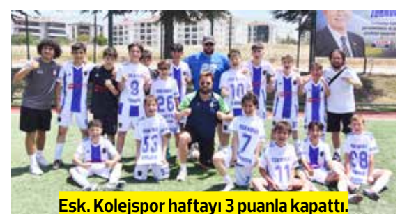
Esk. Kolejspor haftayı 3 puanla kapattı.