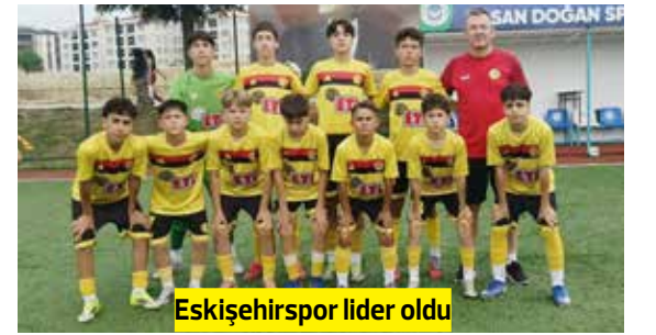
Eskişehirspor lider oldu

Beşinci hafta maçları çarşamba günü Hasan Doğan Sahası'nda oynandı. Günün ilk maçında Esk. Kolejspor, Birlikspor'u 3-1'lik skorla mağlup etti. İkinci maçta averajla liderlik koltuğunda oturan Çelikor-duspor, Elit FK karşısında 5-0'lık skorla güldü. Ardından ikinci sıradaki Eskişehirspor, Altyapı Derneği'ni 10-1 gibi farklı bir skorla mağlup etmeyi başardı. Günün son maçında ise DSİ Bentspor ile Minik Şimşekler 2-2 berabere kaldı. Beşinci hafta sonunda ligin zirvesinde değişiklik yaşandı. Farklı bir galibiyete imza atan Eskişehirspor, puanını 13 yaptı ve averajla liderlik koltuğuna oturdu. HABER MERKEZİ