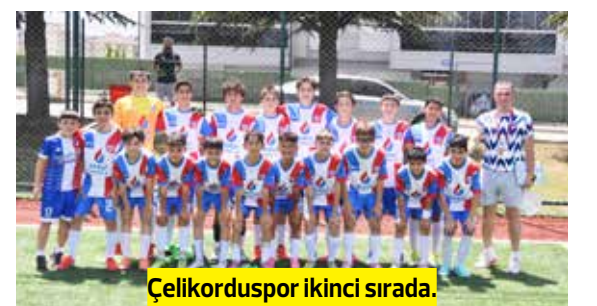
Çelikor-duspor ikinci sırada.