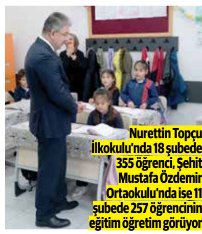
Nurettin Topçu İlkokulu'nda 18 şubede 355 öğrenci, Şehit Mustafa Özdemir Ortaokulu'nda ise 11 şubede 257 öğrencinin eğitim öğretim görüyor

■Eskişehir'i ileriye götürecek eserler kazandıracaklarını söyleyen Vali Yılmaz, "Bir milleti yükseltecek olan, bir devleti güçlü kılacak olan; eğitilmiş insanların varlığı ve eğitimin kalitesiyle doğru orantılıdır" dedi. >5'TE