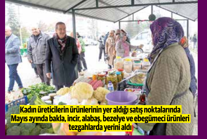
Kadın üreticilerin ürünlerinin yer aldığı satış noktalarında Mayıs ayında bakla, incir, alabaş, bezelye ve ebegümeci ürünleri tezgahlarda yerini aldı

■Emeğin yanında olduğunu söyleyen Ataç, "Tüm hemşehrilerimizi kadın emeğine destek olmak, yerel üreticilerimizin yanında durmak ve doğal ürünlere ulaşmak için satış noktalarımıza davet ediyoruz" diye konuştu. >6'DA