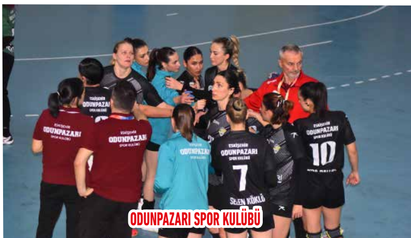
ODUNPAZARI SPOR KULÜBÜ