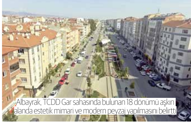
Albayrak, TCDD Gar sahasında bulunan 18 dönümü aşkın alanda estetik mimari ve modern peyzaj yapılmasını belirtti

>>Albayrak, "İhale şartnamesinde yer alan en az 100 Milyon TL'lik yatırım şartı, hayata geçirilecek projenin niteliği ve ciddiyetinin en somut göstergesidir. Eskişehir, her zaman en iyisini ve en güzelini hak ediyor" dedi. >7'DE