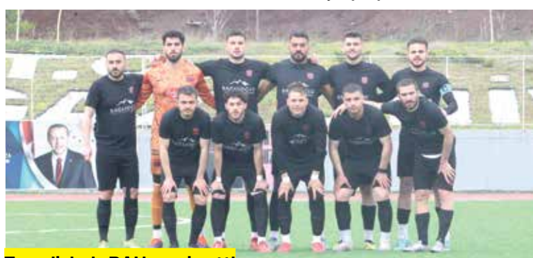
Temsilcimizi BAL'a veda etti