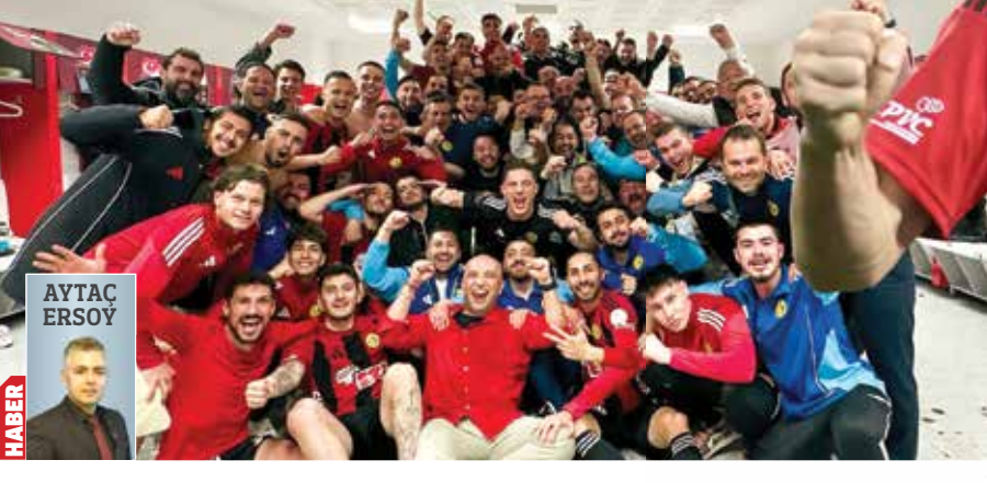
AYTAC ERSÖV HABER

>>3. Lig Play-Off ilk tur maçında Balıkesirspor'a 2-1 kaybeden Eskişehirspor, rövanşta 33 bini aşkın taraftarının büyük desteğiyle rakibini 3-0 yenip tur atladı. Akın Akman'ın 2 gol 1 asist yaparak yıldızlaştığı maç sonrası şampiyonluğa olan inanç bir kat daha arttı. >12'DE